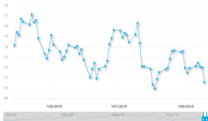
图 3: OPEC 篮子价格走势 (美元/桶):