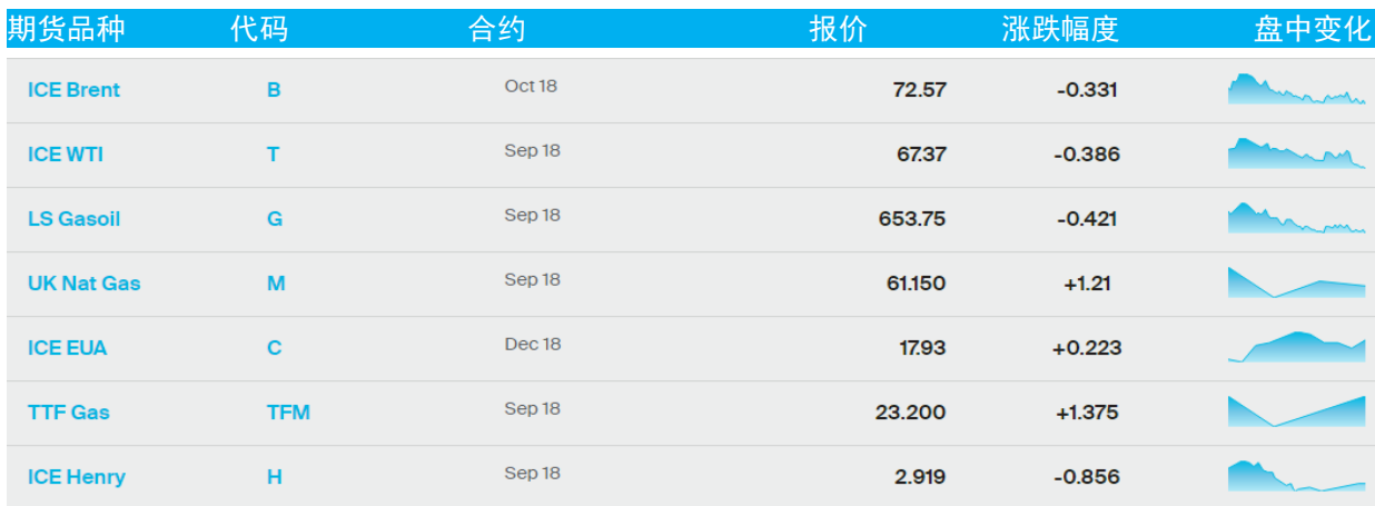
表 1：ICE 洲际交易所主要原油期货当日报价