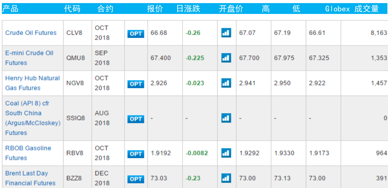
表 3：CME GROUP 芝加哥交易所主要原油期货当日报价