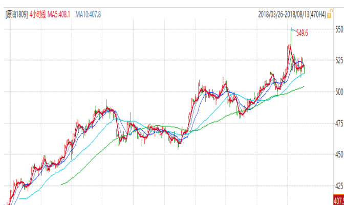
图 4: 上海原油期货 1809 合约价格走势 (人民币/桶)