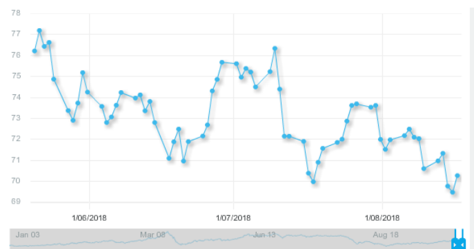
图 3：欧佩克参考篮子（ORB）价格走势（美元/桶）：