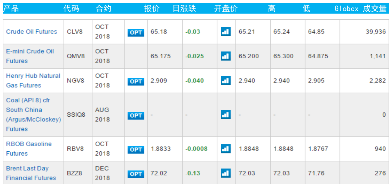
表 3：CME GROUP 芝加哥交易所主要原油期货当日报价