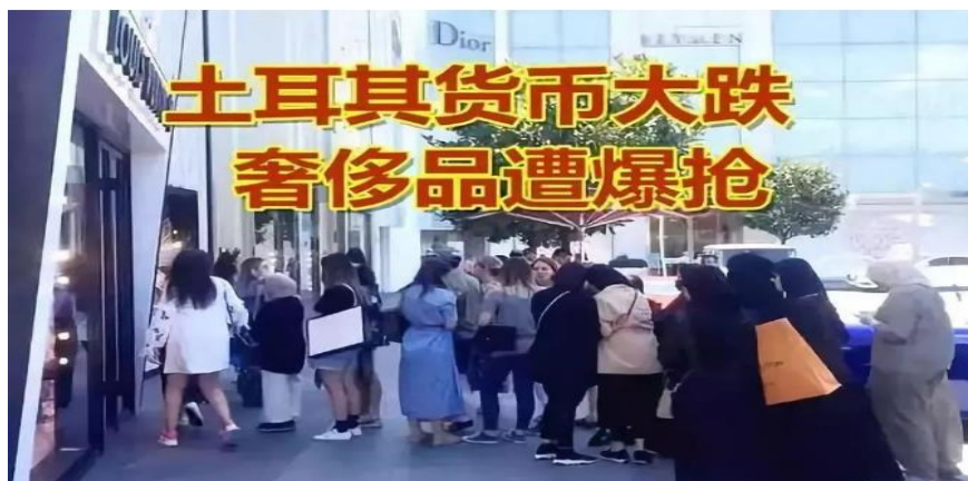
图 1：美国制裁土耳其短短几天土耳其货币贬值超过 40%：

有消息称美国管道运能瓶颈制约北美原油产能增长，数据显示，北美本土原油日产量近期以来的增速似乎出现了放缓迹象，这令伊朗原油被禁运后能否有足够的补充产能填补供给空缺再度生疑。这对油价是个利好。