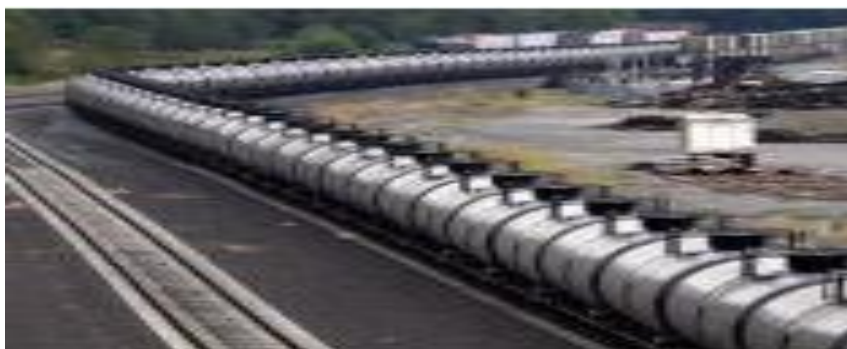
图 1：加拿大石油管道图：

9月7日也门南部的抗议活动继续蔓延，抗议者一直在抗议政府的政策，威胁称也门政府不满足也门南部抗议者的要求，将暂停从该地区运送石油。据估计，也门的石油储量为 30 亿桶，石油产量在 2001 年达到顶峰，达到 44.1 万桶/日，也门 2014 年原油产量估计为每日 10 万桶左右。该消息利好油价。