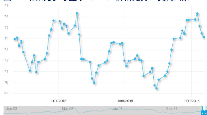
图 3：欧佩克参考篮子（ORB）价格走势（美元/桶）：