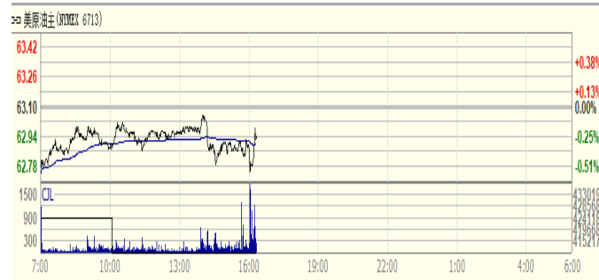
图 2: WTI 原油期货价格走势 (美元/桶)