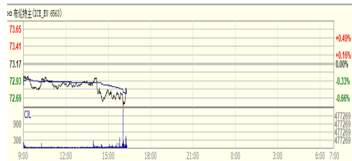
图 1: Brent 原油期货价格走势 (美元/桶)