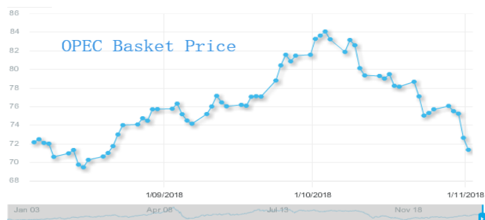
图 3: 欧佩克参考篮子 (ORB) 价格走势 (美元/桶):