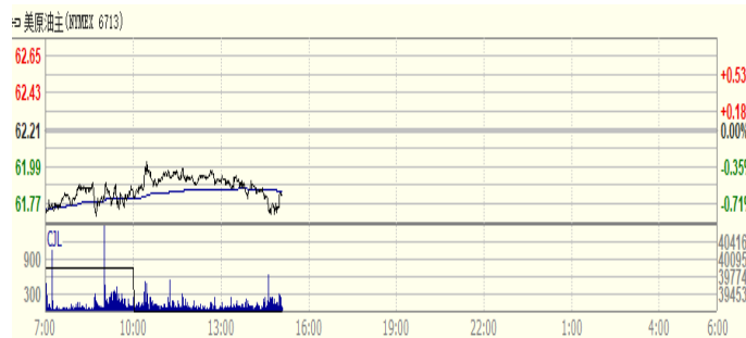
图 2: WTI 原油期货价格走势 (美元/桶)