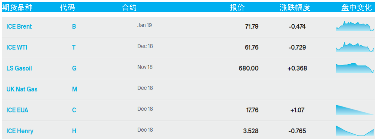
表 1：ICE 洲际交易所主要原油期货当日报价