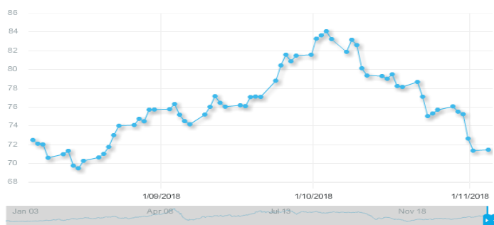
图 3: 欧佩克参考篮子 (ORB) 价格走势 (美元/桶):