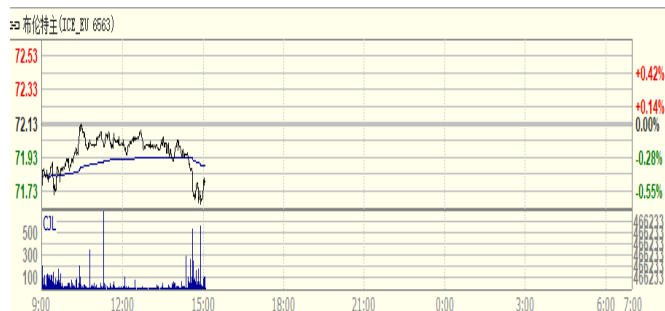
图 1: Brent 原油期货价格走势 (美元/桶)