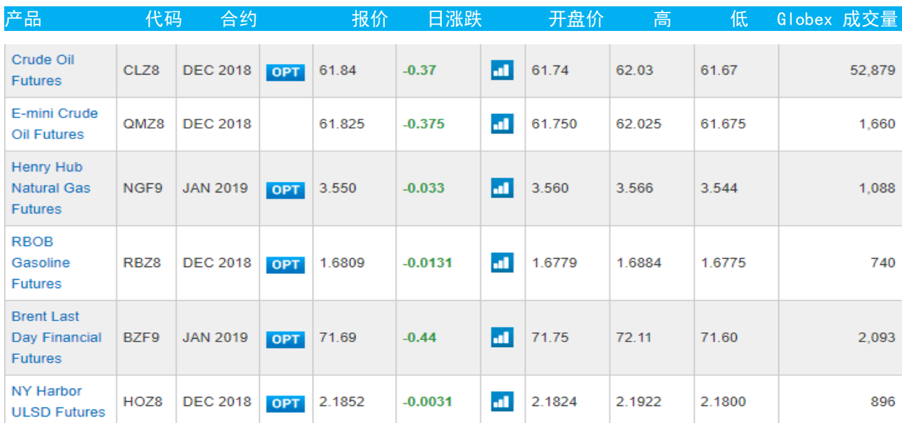
表 3：芝加哥交易所能源期货及期权当日报价