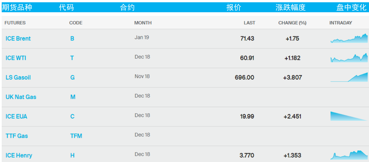
表 1：ICE 洲际交易所主要原油期货当日报价