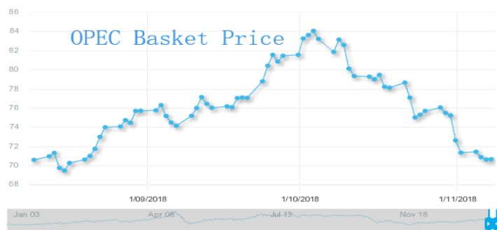
图 3: 欧佩克参考篮子 (ORB) 价格走势 (美元/桶):