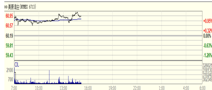
图 2: WTI 原油期货价格走势 (美元/桶)