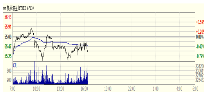
图 2: WTI 原油期货价格走势 (美元/桶)