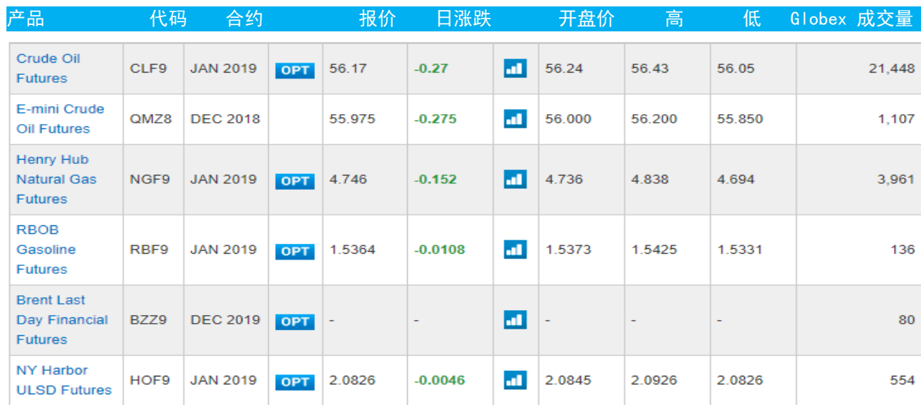
表 3：芝加哥交易所能源期货及期权当日报价