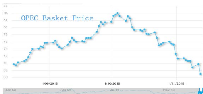
图 3: 欧佩克参考篮子 (ORB) 价格走势 (美元/桶):