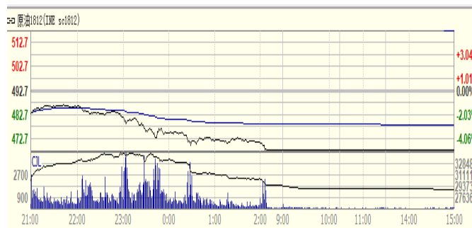
图 4: 上海原油期货 1812 合约价格走势 (人民币/桶)