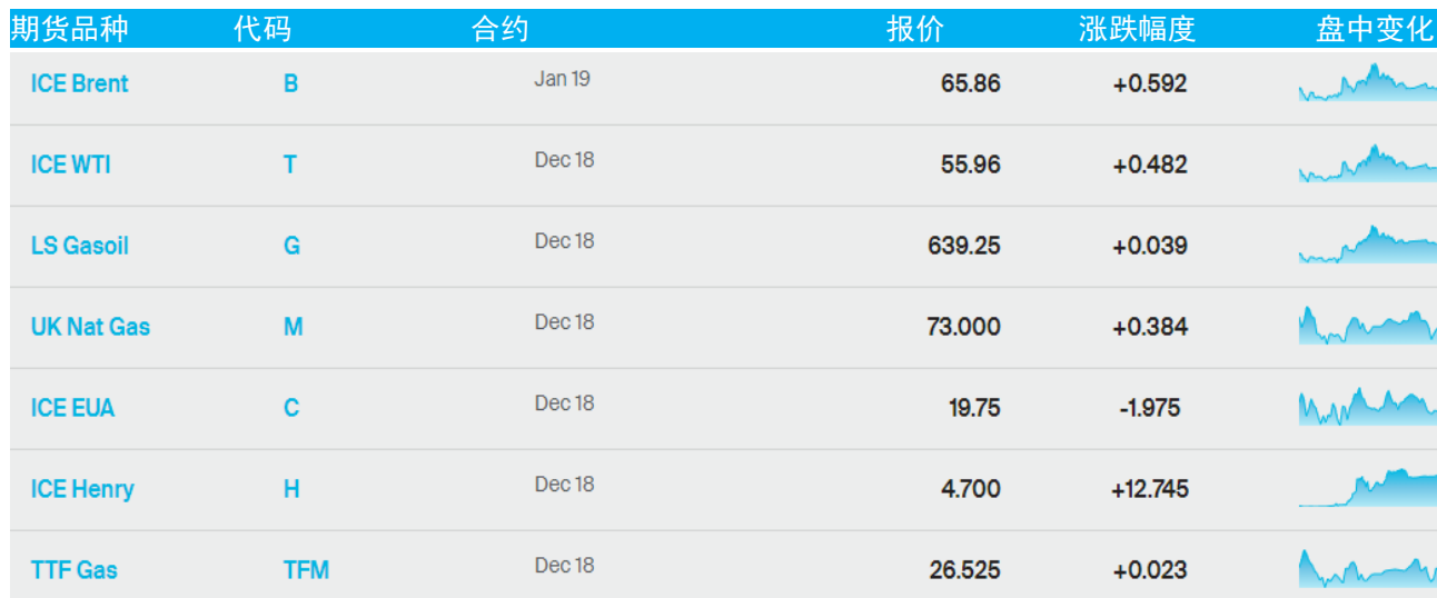
表 1：ICE 洲际交易所主要原油期货当日报价