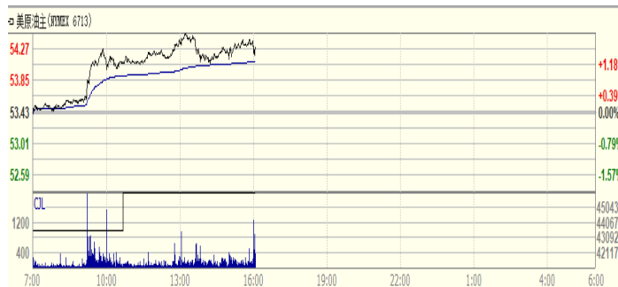
图 2: WTI 原油期货价格走势 (美元/桶)