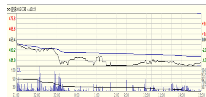
图 4: 上海原油期货 1812 合约价格走势 (人民币/桶)