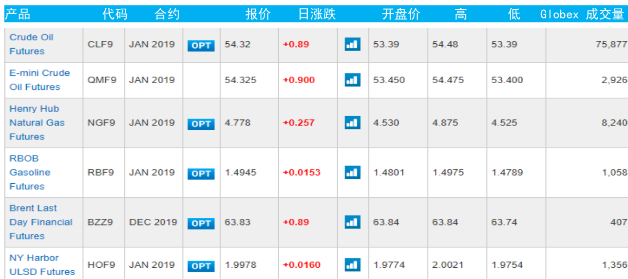
表 3：芝加哥交易所能源期货及期权当日报价