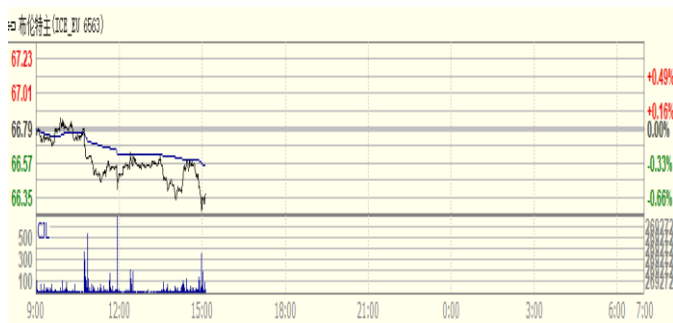
图 1: Brent 原油期货价格走势 (美元/桶)