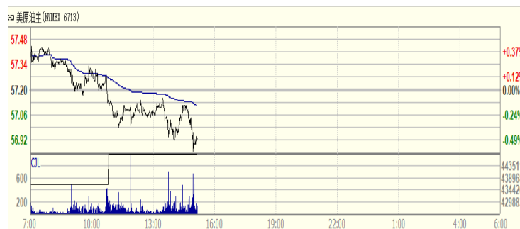
图 2: WTI 原油期货价格走势 (美元/桶)