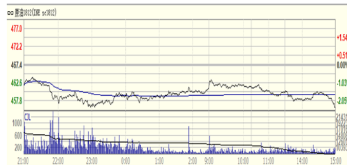
图 4: 上海原油期货 1812 合约价格走势 (人民币/桶)