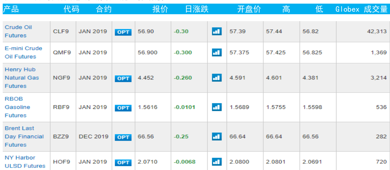
表 3：芝加哥交易所能源期货及期权当日报价