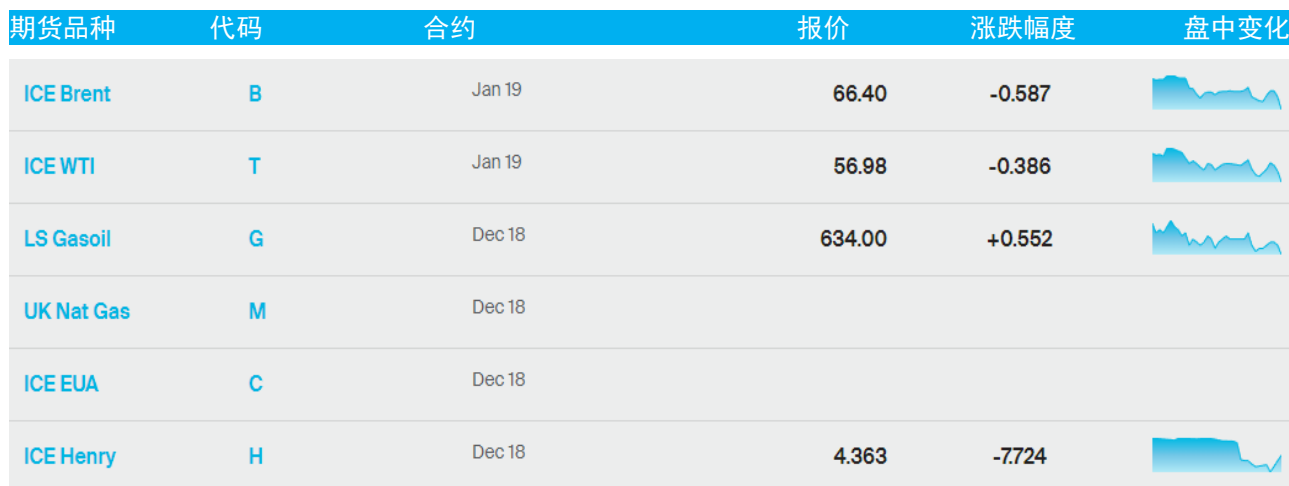
表 1：ICE 洲际交易所主要原油期货当日报价