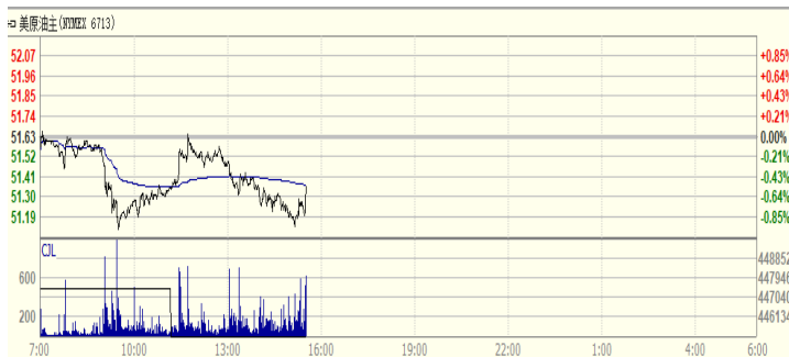
图 2: WTI 原油期货价格走势 (美元/桶)