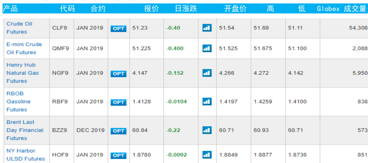
表 3：芝加哥交易所能源期货及期权当日报价