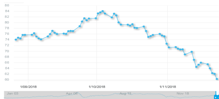
图 3: 欧佩克参考篮子 (ORB) 价格走势 (美元/桶)