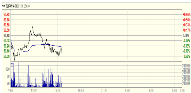
图 1: Brent 原油期货价格走势 (美元/桶)