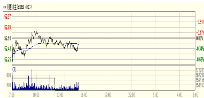
图 2: WTI 原油期货价格走势 (美元/桶)