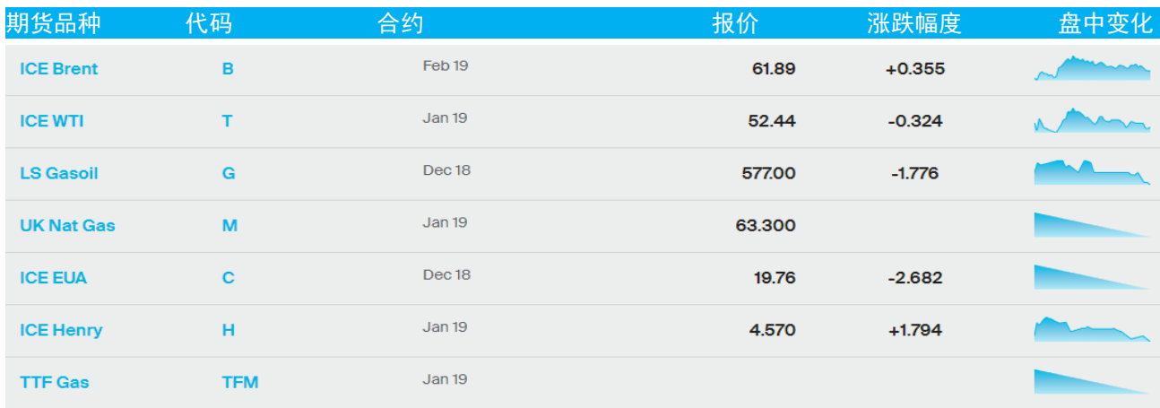
表 1：ICE 洲际交易所主要原油期货当日报价