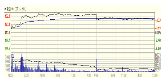
图 4: 上海原油期货 1901 合约价格走势 (人民币/桶)