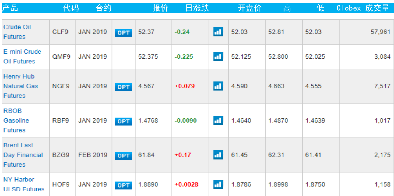
表 3：芝加哥交易所能源期货及期权当日报价