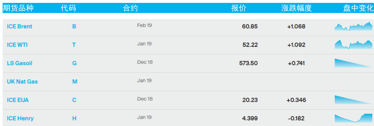
表 1：ICE 洲际交易所主要原油期货当日报价