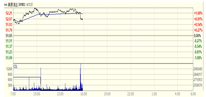
图 2: WTI 原油期货价格走势 (美元/桶)