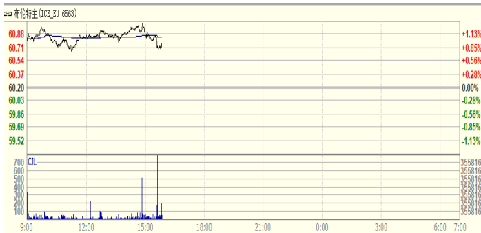
图 1: Brent 原油期货价格走势 (美元/桶)