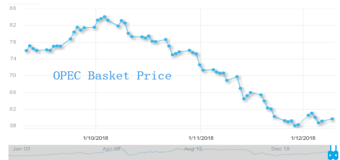
图 3: 欧佩克参考篮子 (ORB) 价格走势 (美元/桶):