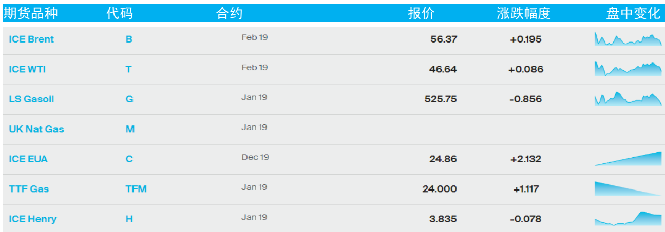
表 1：ICE 洲际交易所主要原油期货当日报价