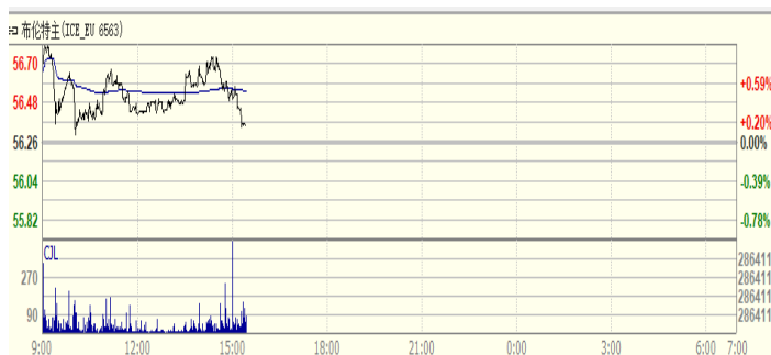
图 1: Brent 原油期货价格走势 (美元/桶)