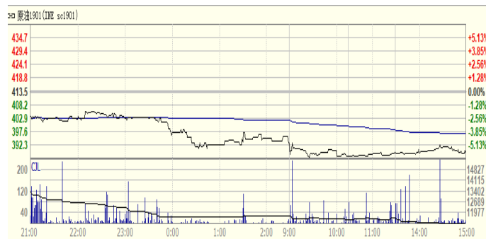
图 4: 上海原油期货 1901 合约价格走势 (人民币/桶)