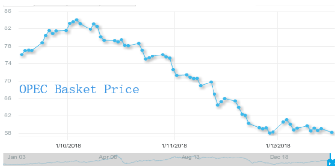
图 3: 欧佩克参考篮子 (ORB) 价格走势 (美元/桶)