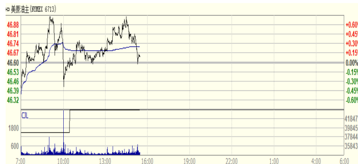
图 2: WTI 原油期货价格走势 (美元/桶)