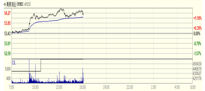
图 2: WTI 原油期货价格走势 (美元/桶)