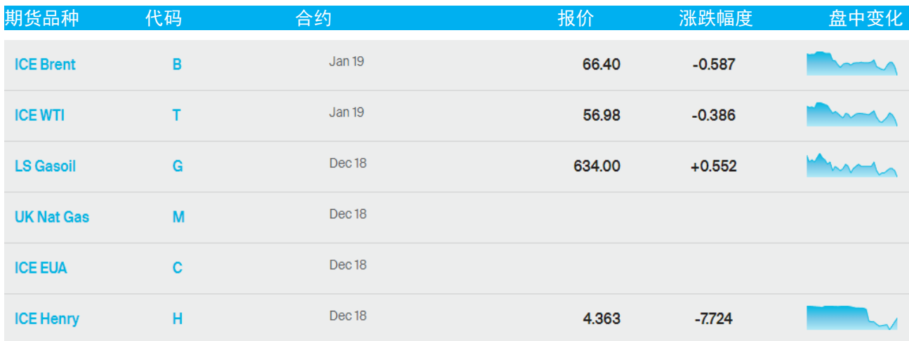
表 1：ICE 洲际交易所主要原油期货当日报价