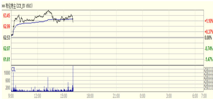
图 1: Brent 原油期货价格走势 (美元/桶)