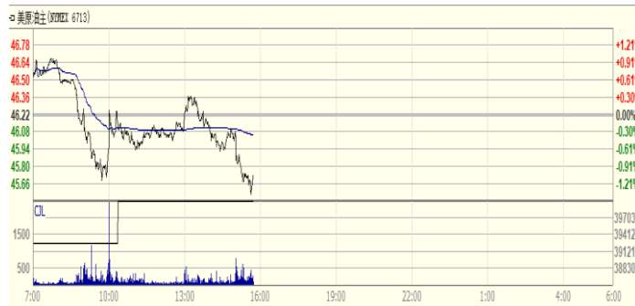
图 2: WTI 原油期货价格走势 (美元/桶)