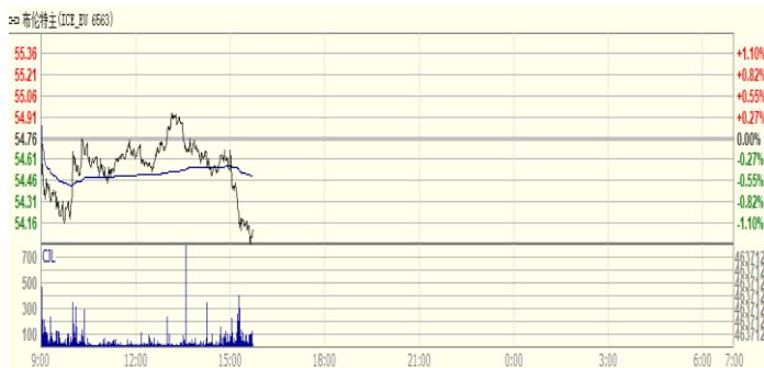
图 1: Brent 原油期货价格走势 (美元/桶)