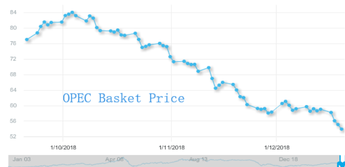
图 3: 欧佩克参考篮子 (ORB) 价格走势 (美元/桶):