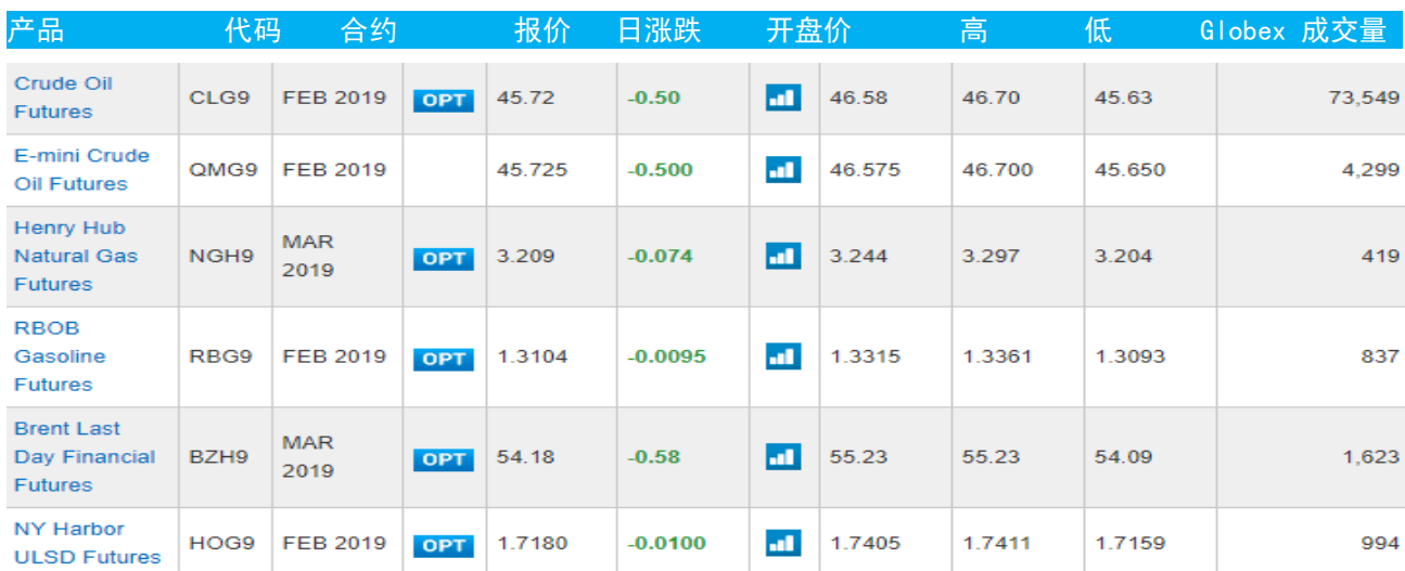
表 3：CME GROUP 芝加哥交易所主要原油期货当日报价