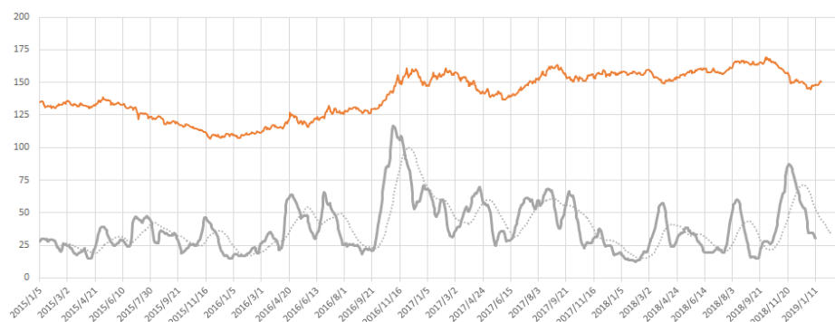
文华商品指数与波动率对比