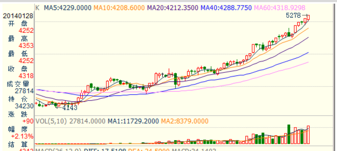
图 2: 连鸡蛋 K 线图