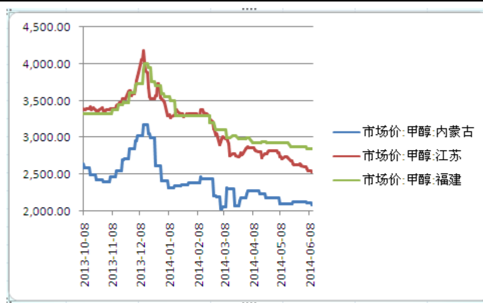
图3 甲醇市场价走势图