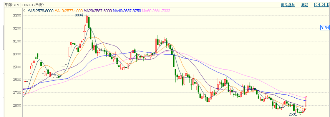
图 1: 甲醇 K 线图