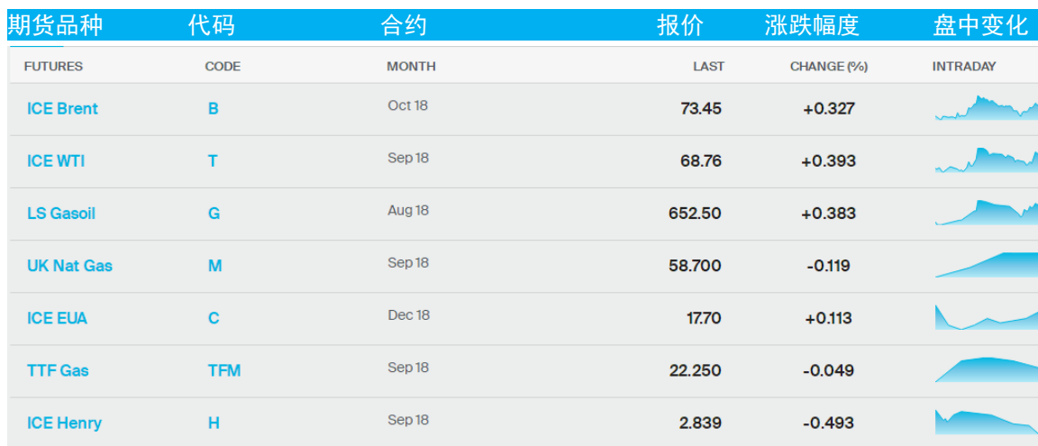
表 1：ICE 洲际交易所主要原油期货当日报价