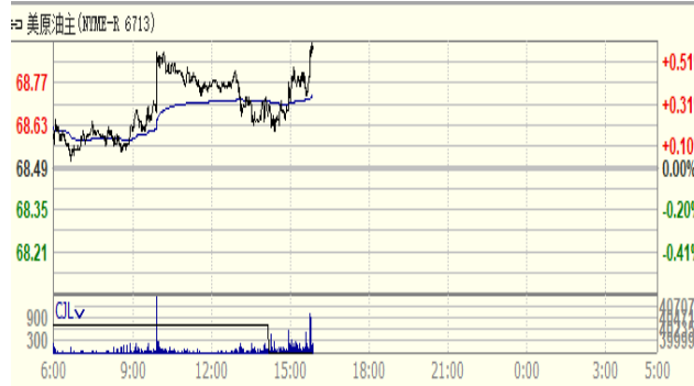
图 2: WTI 原油期货价格走势 (美元/桶)