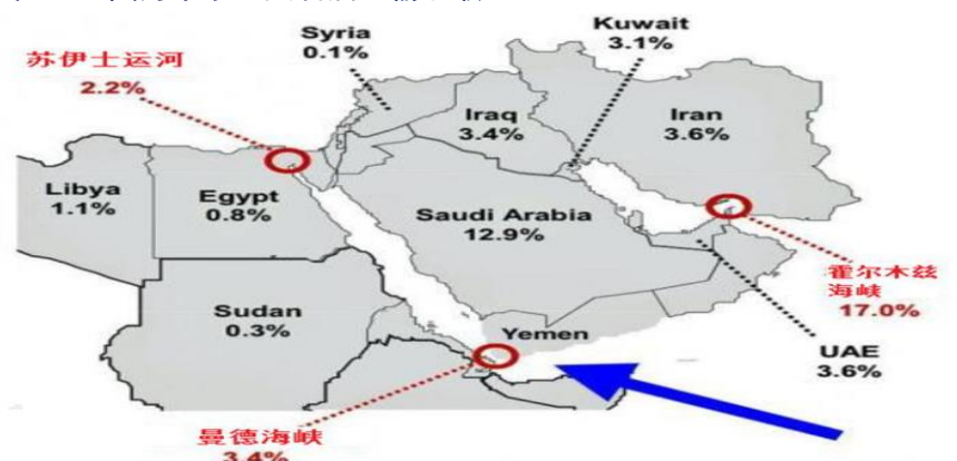
图 1：下图为中东三大石油运输咽喉：

与此同时美伊冲突的升级，伊朗威胁要封锁石油运输要道霍尔木兹海峡，美国国防部表示，如果伊朗封锁霍尔木兹海峡，美国将不惜一切手段重新开放这一海上石油运输要道。如果经过这些海上重要航道的石油运输停止可能会引发冲突升级，油价短时间都会暴涨。