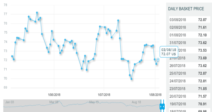
图 3: OPEC 篮子价格走势 (美元/桶):