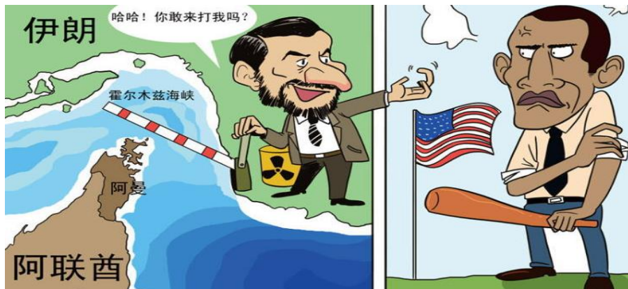
图 1：霍尔木兹海峡是伊朗的筹码：

伊朗通讯社报道，伊朗已经开始在波斯湾进行大规模海军演习，伊朗称演习是在革命卫队年度演习的框架下展开，目的是控制并保卫国际水道。霍尔木兹海峡是连通波斯湾与阿拉伯海的唯一水道，也是国际石油运输的重要航线，伊朗扼守霍尔木兹海峡北岸，并拥有潜艇、水雷、反舰导弹与弹道导弹等多种区域武器装备。美军中央司令部表示，伊朗海军的活动趋向活跃，并已将活动范围扩展至霍尔木兹海峡。可能有多达 100 艘以上的伊朗海军舰艇参与了演习。伊朗此举旨在给不断对伊朗施压的美国特朗普政府传递信号。伊朗表示如果伊朗石油的出口被限制，将封锁霍尔木兹海峡，届时其它国家也无法运输石油。该事件继续提振油价随时暴涨。