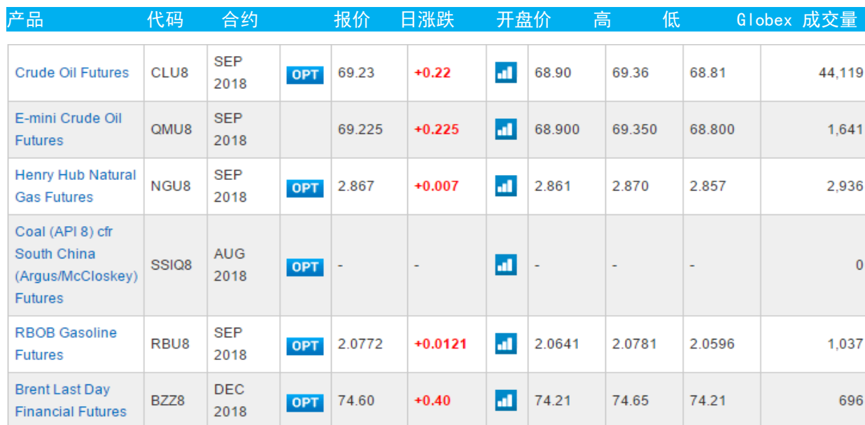
表 3：CME GROUP 芝加哥交易所主要原油期货当日报价