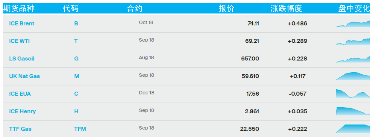
表 1：ICE 洲际交易所主要原油期货当日报价