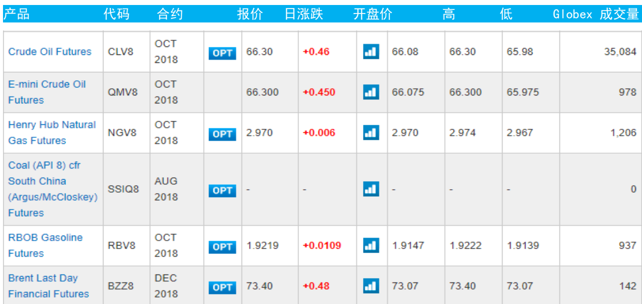
表 3：CME GROUP 芝加哥交易所主要原油期货当日报价