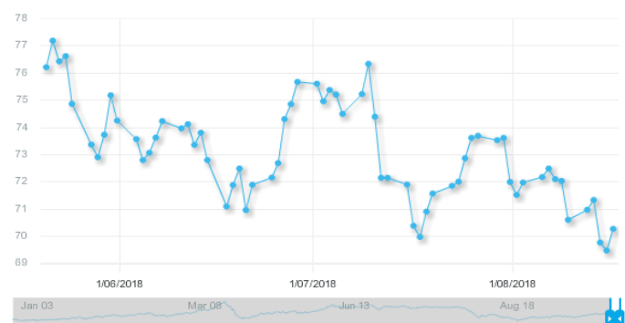
图 3：欧佩克参考篮子（ORB）价格走势（美元/桶）：