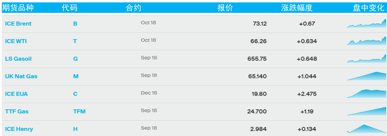
表 1：ICE 洲际交易所主要原油期货当日报价