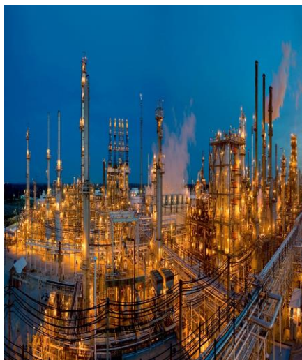
机构和专业投资者的选择：投资原油 上海国际能源交易中心：INC SC 原油 ——真正的商品之王