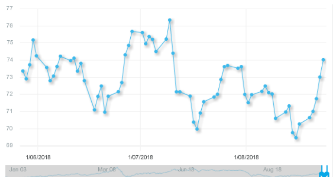
图 3：欧佩克参考篮子（ORB）价格走势（美元/桶）：