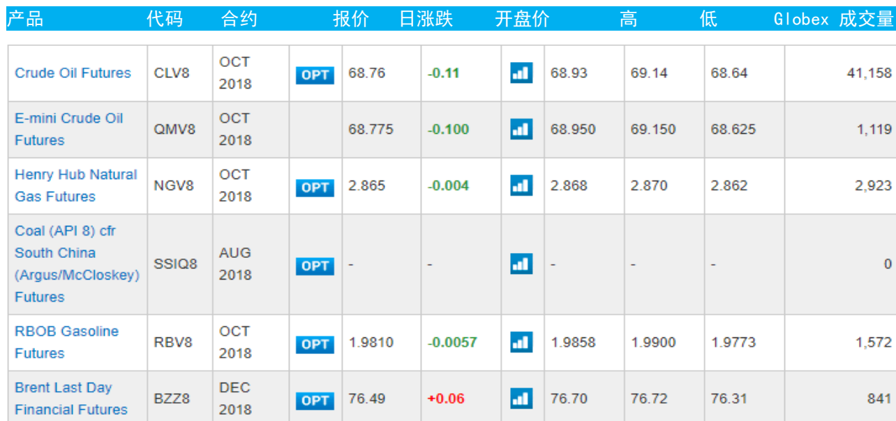
表 3：CME GROUP 芝加哥交易所主要原油期货当日报价