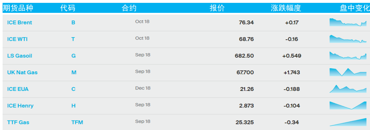
表 1：ICE 洲际交易所主要原油期货当日报价