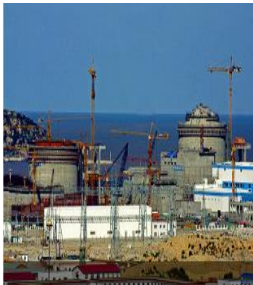
机构和专业投资者的选择：投资原油 上海国际能源交易中心：INC SC 原油 ——真正的商品之王

中融汇信研究院 首席研究员：马金子 期货从业资格号：F3047920 高级黄金投资分析师资格证号： 1619 0000 0015 0690 中级黄金投资分析师资格证号： 0800 0000 0020 1963