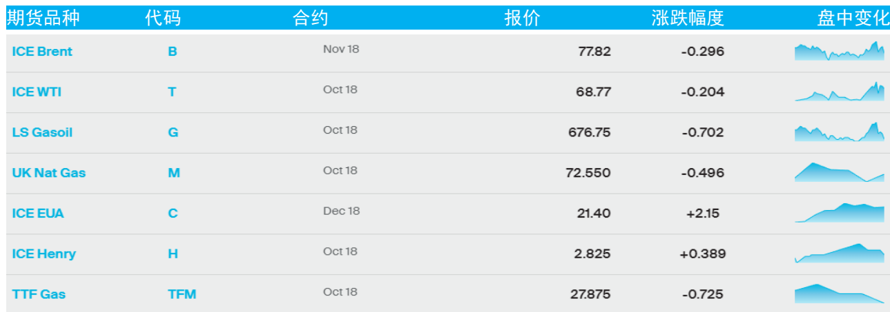
表 1：ICE 洲际交易所主要原油期货当日报价