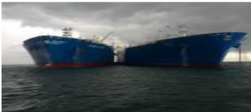
图 1：国际运输石油的邮轮图：

据英国《金融时报》报道，目前，法国、德国和英国正与欧盟官员就这一独立支付渠道展开合作。该渠道将使欧洲企业能够绕开美国，继续与伊朗进行贸易。欧盟希望确保美国的制裁对那些仍愿意与伊朗合法贸易的欧洲公司所产生的影响降至最低。为绕过美国制裁，伊朗有意利用以物易物系统，也就是在石油进口国开设账户收取买油款项，伊朗再利用该笔资金于他国购买所需商品。欧洲炼油商也在今夏初开始减少采购伊朗原油。像道达尔等欧洲能源公司已经放弃了对伊朗的投资。虽然欧洲不会像2012-2015年那样制裁伊朗但也足以证明欧洲将减少购买伊朗原油。该消息利空油价。