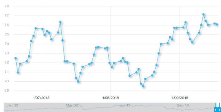
图 3：欧佩克参考篮子（ORB）价格走势（美元/桶）：