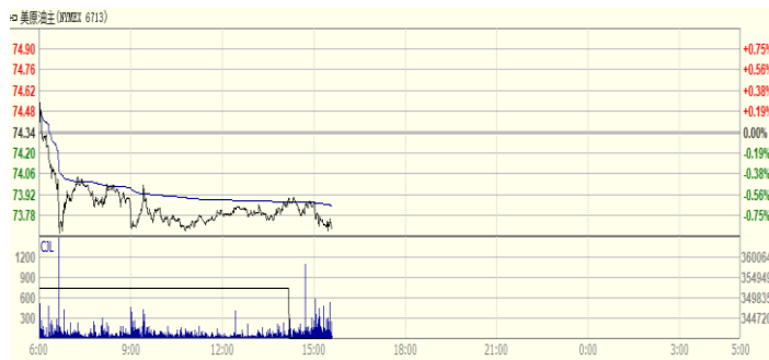
图 2: WTI 原油期货价格走势 (美元/桶)