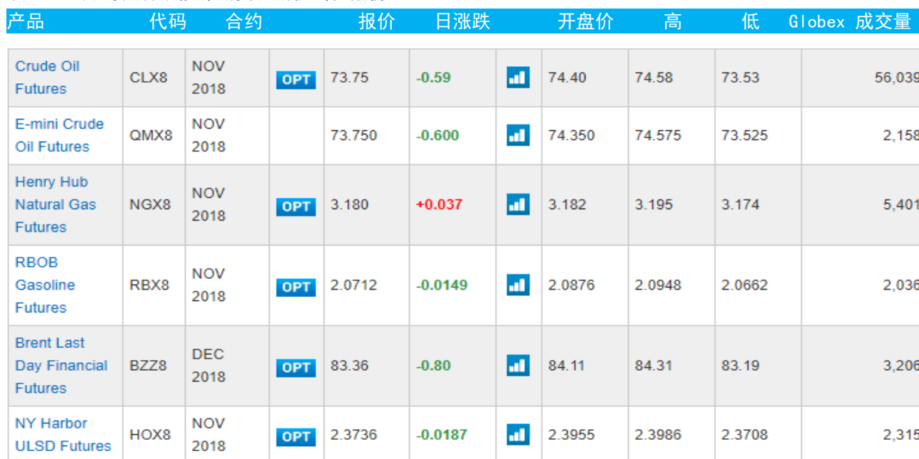
表 3：芝加哥交易所能源期货及期权当日报价