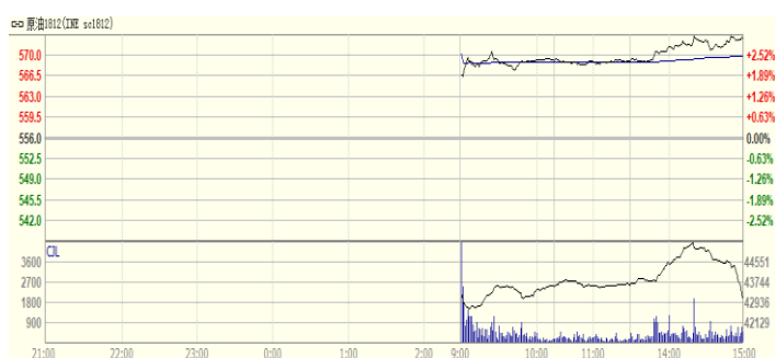
图 4: 上海原油期货 1812 合约价格走势 (人民币/桶)