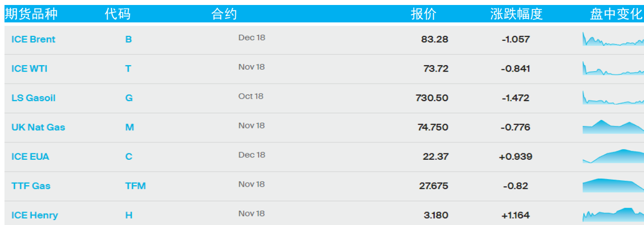
表 1：ICE 洲际交易所主要原油期货当日报价