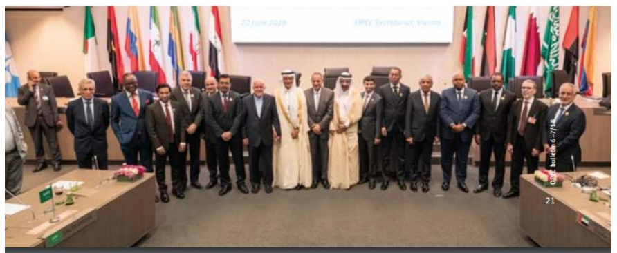
图 1：OPEC 会议图：

《纽约时报》报道称，伊朗外交部长表示，伊朗和欧洲试图建立一个支付伊朗石油的机制，以物物交换或是本币计价，而不是用美元。这个想法是绕过美国，防止美国阻止财务转移。英国《金融时报》也曾报道，欧盟正就启动新的支付渠道进行谈判，该渠道将使欧洲企业能够绕开美国，继续与伊朗进行贸易。英法德三国也就在考虑让伊朗直接在本国央行开户，由此进行石油交易。该消息利空油价。