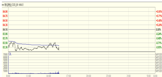
图 1: Brent 原油期货价格走势 (美元/桶)