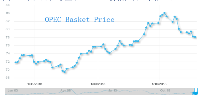
图 3：欧佩克参考篮子（ORB）价格走势（美元/桶）：