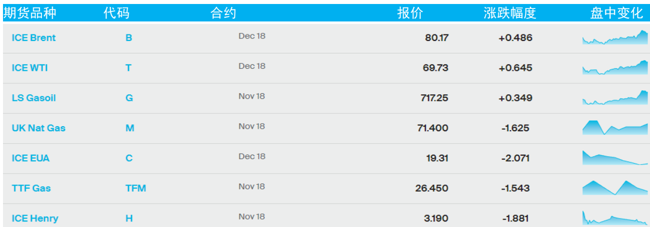
表 1：ICE 洲际交易所主要原油期货当日报价