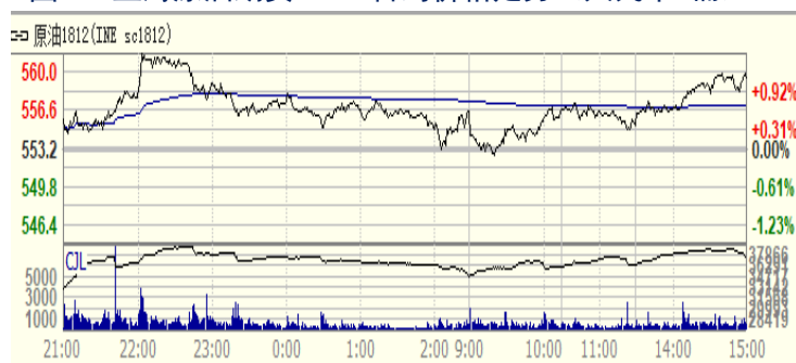
图 4：上海原油期货 1812 合约价格走势（人民币/桶）