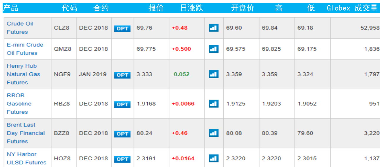
表 3：芝加哥交易所能源期货及期权当日报价