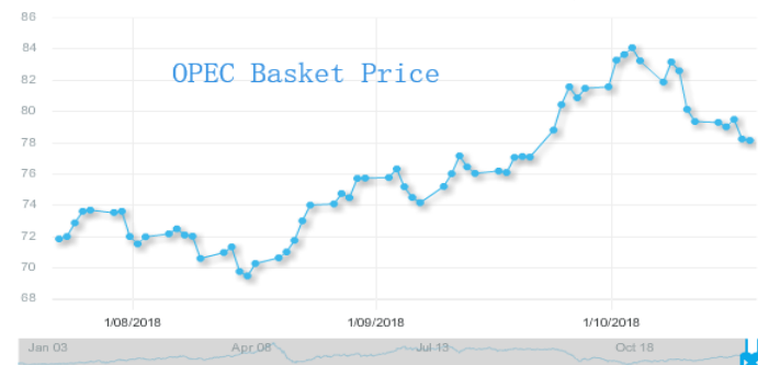
图 3：欧佩克参考篮子（ORB）价格走势（美元/桶）：