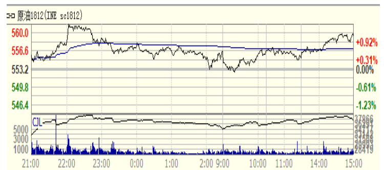
图 4：上海原油期货 1812 合约价格走势（人民币/桶）