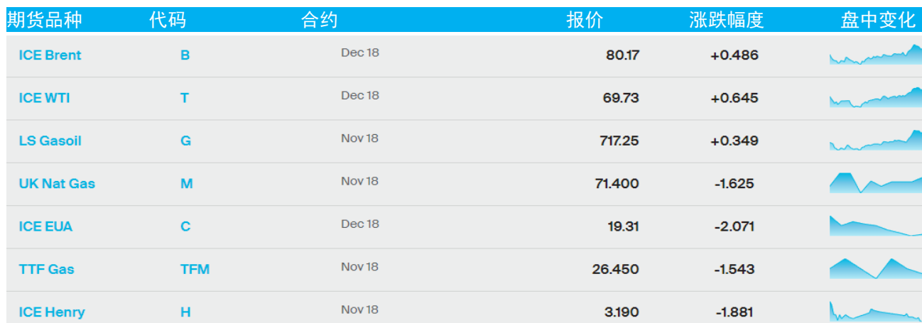
表 1：ICE 洲际交易所主要原油期货当日报价