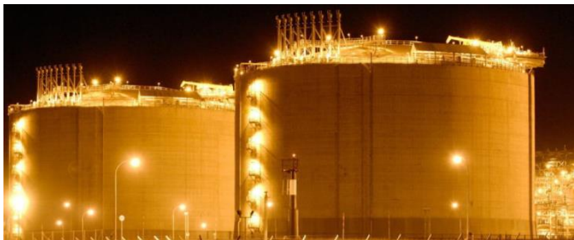
图 1: OPEC 油库图:

据外媒报道美国总统特朗普向媒体表示,如果沙特与就一名批评政府的沙特记者失踪一事,将对沙特实施严厉的惩罚。沙特威胁称,将利用其经济影响力对任何惩罚性措施进行报复。这威胁有可能导致沙特和美国之间的关系出现转变。由于担心与美国的关系可能恶化,沙特股市一度下跌7%,为2014年以来最大跌幅。沙特新闻频道负责人称如果美国对沙特实施制裁,我们将面临一场震惊世界的经济灾难,将沙特作为攻击目标将首先打击全球的石油供应。如果特朗普总统对80美元/桶的高油价感到愤怒,没有人能排除油价跳涨至100美元/桶甚至200美元/桶、该消息利好油价。