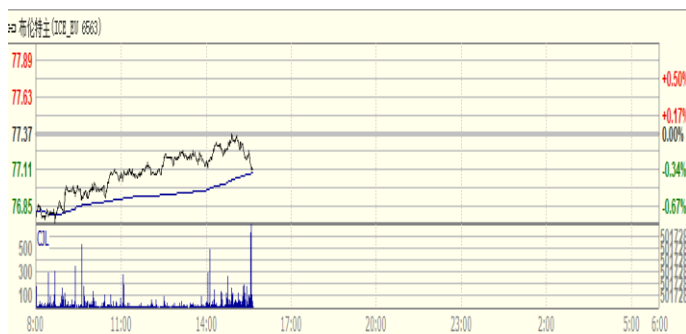
图 1: Brent 原油期货价格走势 (美元/桶)