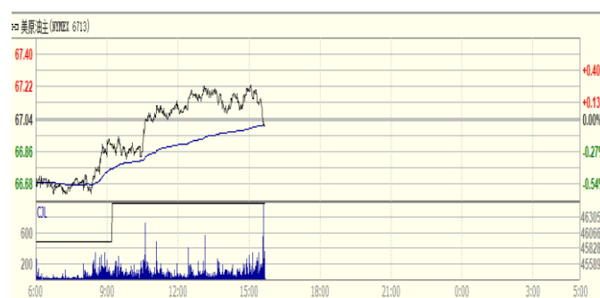
图 2: WTI 原油期货价格走势 (美元/桶)