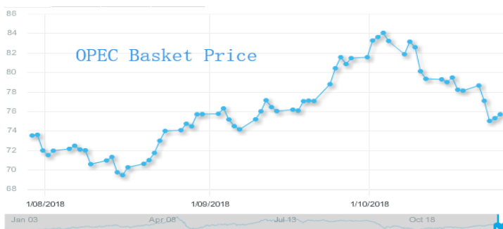
图 3: 欧佩克参考篮子 (ORB) 价格走势 (美元/桶):