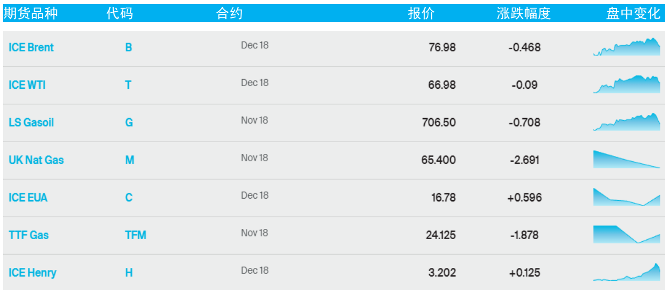
表 1：ICE 洲际交易所主要原油期货当日报价