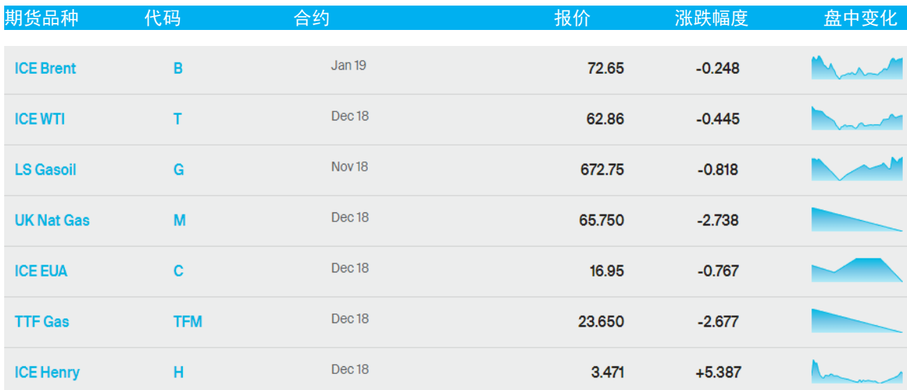
表 1：ICE 洲际交易所主要原油期货当日报价