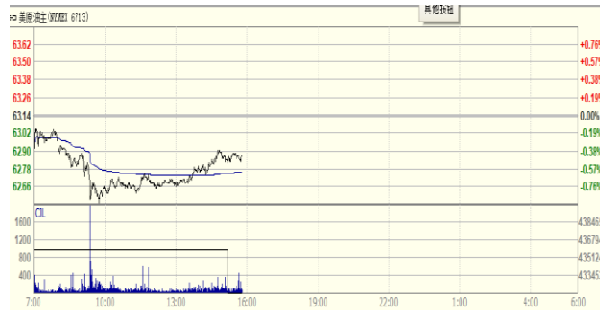
图 2: WTI 原油期货价格走势 (美元/桶)