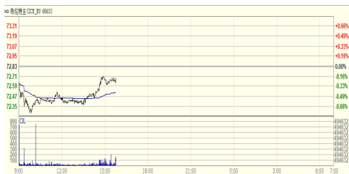
图 1: Brent 原油期货价格走势 (美元/桶)