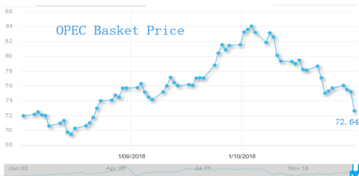
图 3: 欧佩克参考篮子 (ORB) 价格走势 (美元/桶):