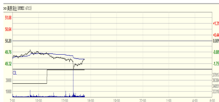
图 2: WTI 原油期货价格走势 (美元/桶)