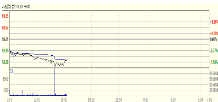
图 1: Brent 原油期货价格走势 (美元/桶)