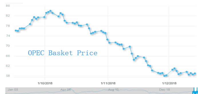
图 3: 欧佩克参考篮子 (ORB) 价格走势 (美元/桶):