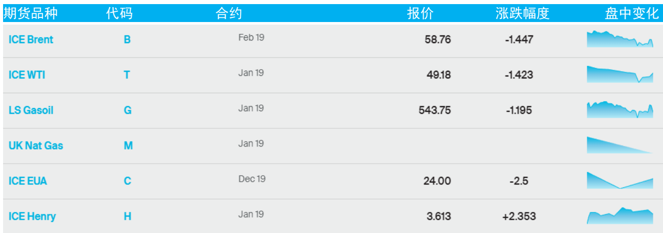
表 1：ICE 洲际交易所主要原油期货当日报价