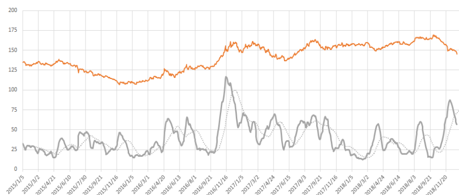
文华商品指数与波动率对比