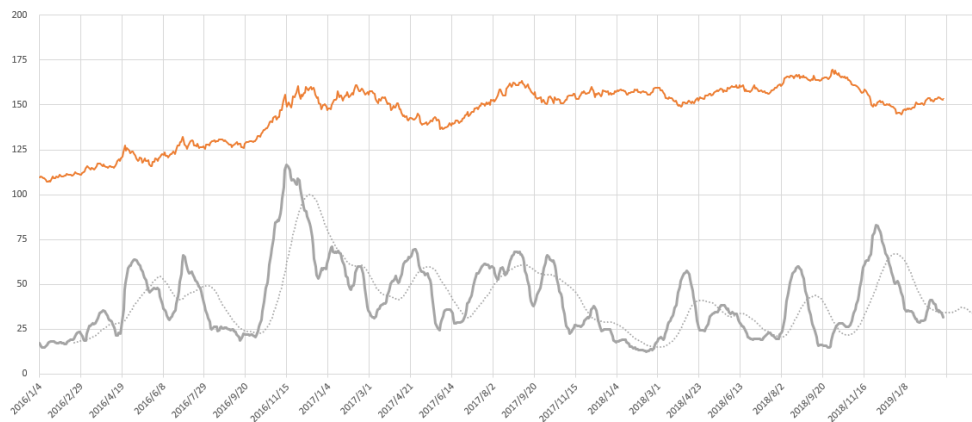
文华商品指数走势与波动率对比