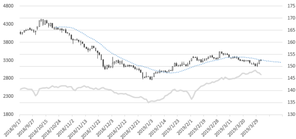
文华商品指数 (持仓量: 万手、左轴)